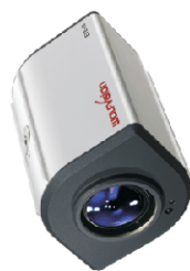
Takmodell för inbyggnad i innertak t.ex.